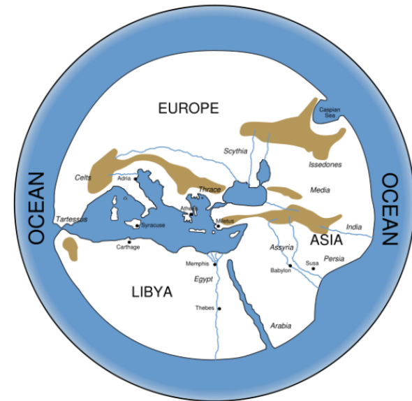
El mundo antiguo según los griegos